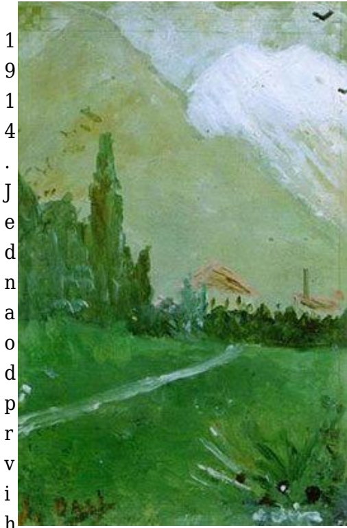
Dalíjevih slika - Krajoblik

Dalíjev otac brzo je shvatio da je njegov sin nije sposoban za javnu školu, pa je upisao šestogodišnjeg Salvadora u Španjolsko-francusku školu Bezgrešnog začeca, gdje je naučio francuski, primarni jezik će kasnije koristiti kao umjetnik.