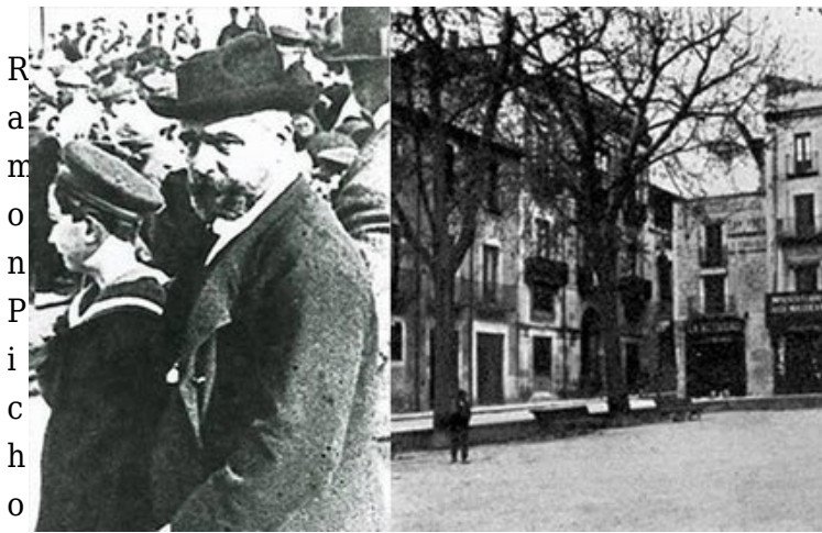
R a m o n P i c h o t i škola crtanja u Figuerasu

Prema tvrdnji iz njegove autobiografije Tajni život Salvadora Dalíja (1942), njegovo djetinjstvo bilo je obilježeno halucinacijama i neobično jakim emocionalnim iskustvima iz kojih su kasnije oblikovani mnogi njegovi snovi i opsesije.